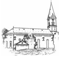
St. Nikolaus (St.N.)