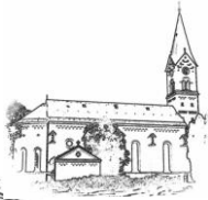
St. Nikolaus (St. N.)