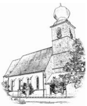
St. Andreas (St. A.)